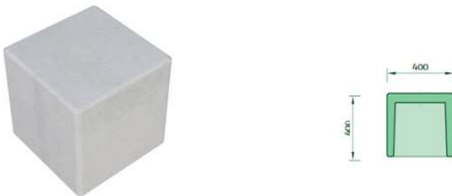
Obr. 3 – Betonová kostka - Zábrana proti vjezdu vozidel